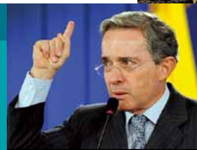
Alvaro Uribe Vélez, Presidente de la República de Colombia

Las cuadrículas mineras dibujaron cada rincón del país, los transgénicos se han impuesto sin mayor resistencia, la agroindustria de la caña, la palma, las flores, y el banano para la exportación se tomaron las mejores tierras del país desplazando a sus pobladores locales, las hidroeléctricas colonizaron la mayor parte de los ríos y en la última semana, el Congreso de la República sigue empeñado en cambiar el texto del Referendo del Agua, haciendo oídos sordos a los más de dos millones de personas que lo respaldaron. Ahora con el nombre Ronda Colombia 2010, la Agencia Nacional de Hidrocarburos (ANH) oferta 170 bloques petroleros, que atraviesan el país de norte a sur y de este a oeste.